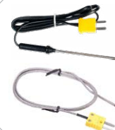
Medición de temperatura sonda (tipo K, de bayoneta) WASONTEMP sonda (tipo K, metal) WASONTEMK2