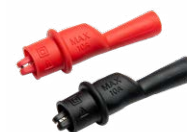
Cocodrilo mini, 1 kV 10 A (juego) WAKROKPL10MINI