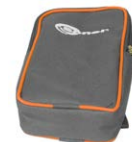
funda S1 WAFUTS1