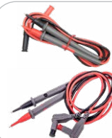
Juego de cables de medición CAT IV, S WAPRZCMM1 CAT IV, M WAPRZCMM2